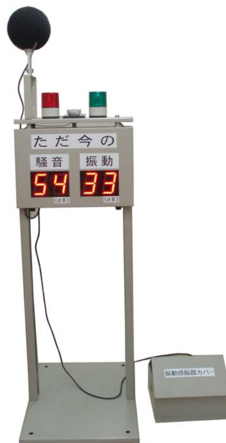
外観・寸法は予告なく変更することがあります