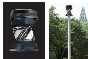
360° プリズム ATP2