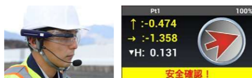
LN-150 ウェアラブルシステム 杭ナビ Vision