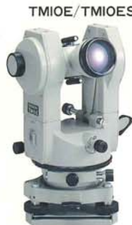
10秒デジタル読み TM10E 着脱式 TM10ESシフティング式