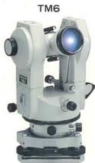
6秒デジタル読み TM6 着脱式

一目的に合わせてセオドライトを一測機舎のデジタル読みセオドライトは、TM20E/ESのほかに、6秒読みTM6、10秒読みTM10E/ES、20秒読みTM20H/HSと種類も豊富です。目的に応じて自由にお選び下さい。