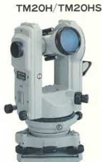
20秒デジタル読み TM20H 着脱式 TM20HSシフティング式